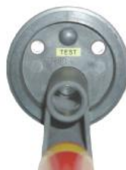
dotkový hrot 420kV