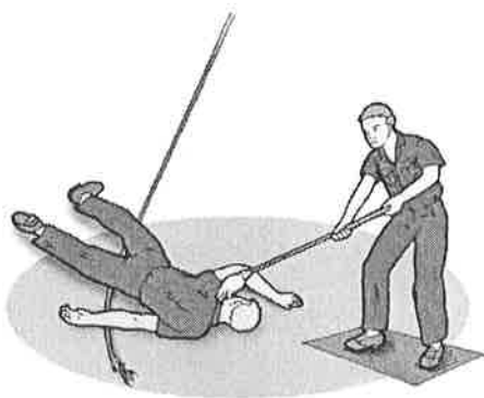
Obr. č.: 1