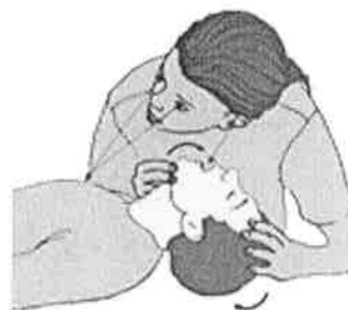
Obr. č.: 2