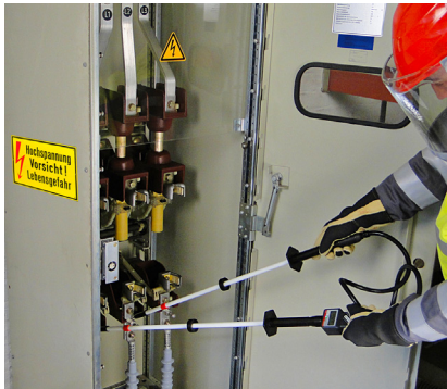
Měření s HS 11 na 10 kV transformátoru

Napětí, polarita a frekvence jsou detekovány několika nezávislými systémy.