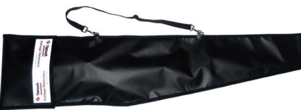
Transportní pouzdro s popruhem