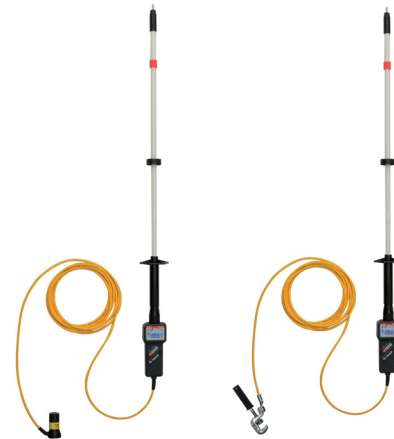
HS 11M s magnetickou a HS 11UK s univerzální svorkou pro pevné připojení jednoho pólu k zemnímu potenciálu.