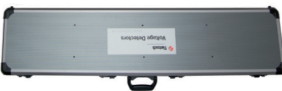
Kufřík s hliníkovým rámem