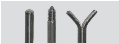
i G Y