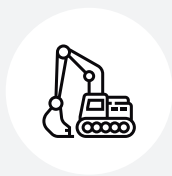
Údržba venkovních zařízení