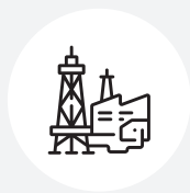
Elektrické rozvodné sítě