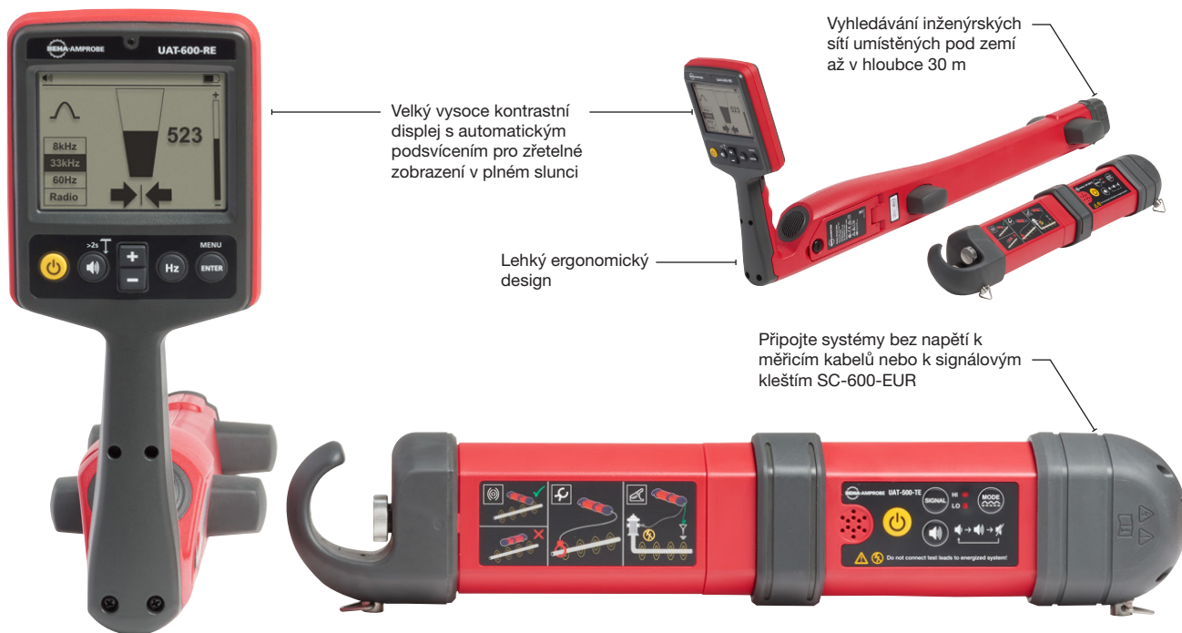
UAT-505-EUR Vyhledávač a trasovač kabelů pod zemí