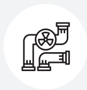
Voda, odpadní voda a kanalizace