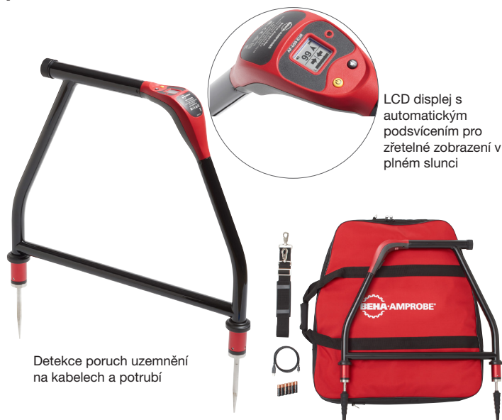
Detekce poruch uzemnění na kabelech a potrubí

AF-600-EUR A-rám pro vyhledávání poruch uzemnění, UAT-600-TE vysílač, SC-600-EUR signální kleště, TL-600-25M prodlužovací měřicí kabel