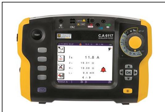
C.A 6116N, C.A 6117