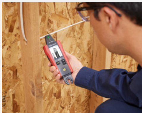
Sleduje živé a neživé vodiče a kabely