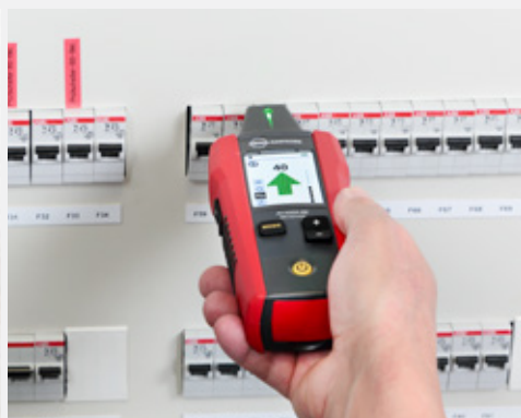
Identifikuje jediný správný jistič